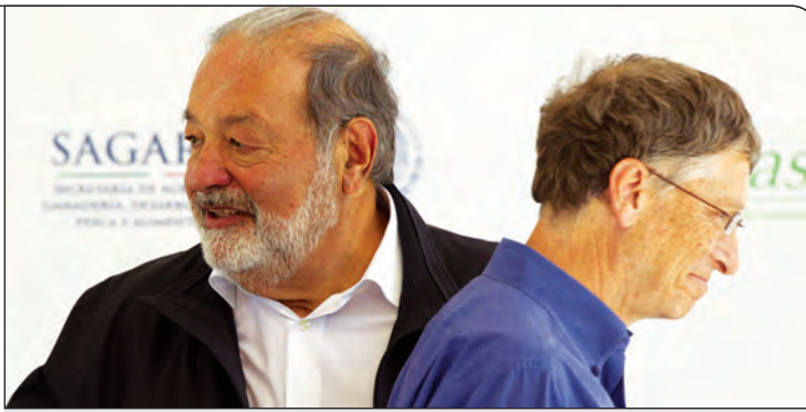
کارلوس اسلیم، او نقش بسیار عمده‌ای در صنایع ارتباطی در مکزیک و آمریکای لاتین دارد

من فکر می‌کنم، خانواده‌ای که در آن متولد شدم، همسر، فرزندانم و دوستانم آرامشی را در زندگی برای من ایجاد کردند که به رمز موفقیت من تبدیل شد.